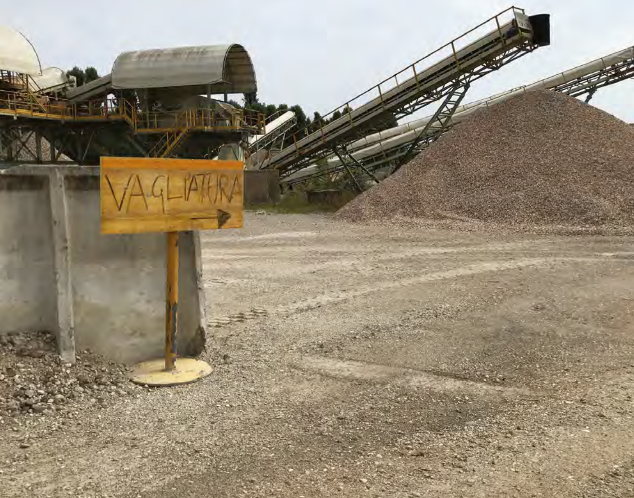
Fig. 14 - Impianto di trattamento della frazione inerte derivante da attività di costruzione e demolizione.