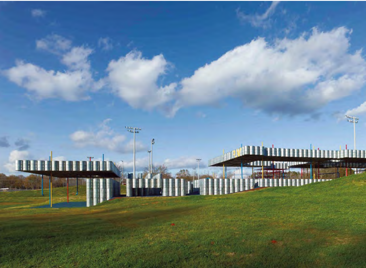
Fig. 7.2 – Lions Park Playscape.