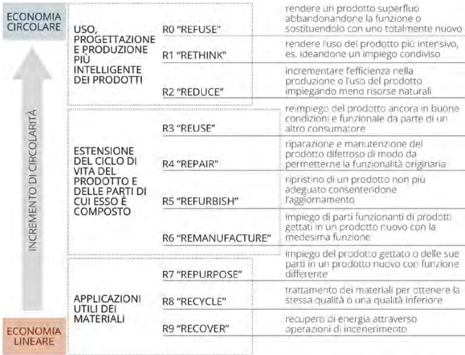
Fig. 2.1 – La “10R framework” individuata attraverso l’analisi di 114 paper incentrati sull’Economia Circolare (da Kirchherr et al., 2017).

l’annessione di numerosi processi a quelli inclusi nella consolidata formula delle 3R ( Reduce, Reuse, Recycle ) o 4R ( Reduce, Reuse, Recycle, Recover ) tale da permettere la formulazione di una cornice a 10R (Kirchherr et al., 2017). (Fig. 2.1)