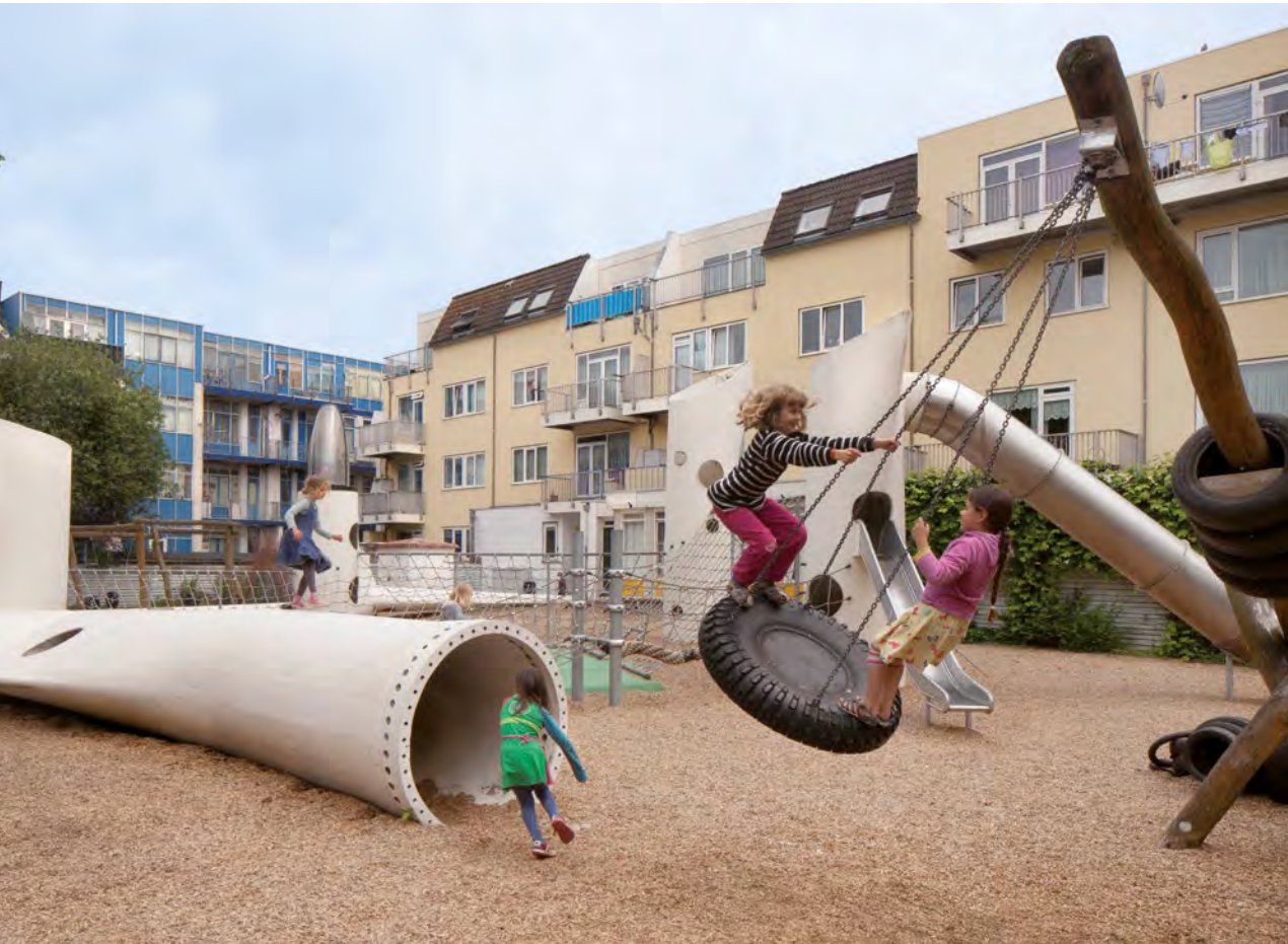
Fig. 7.1 – Wikado (foto: Dennis Guzzo).