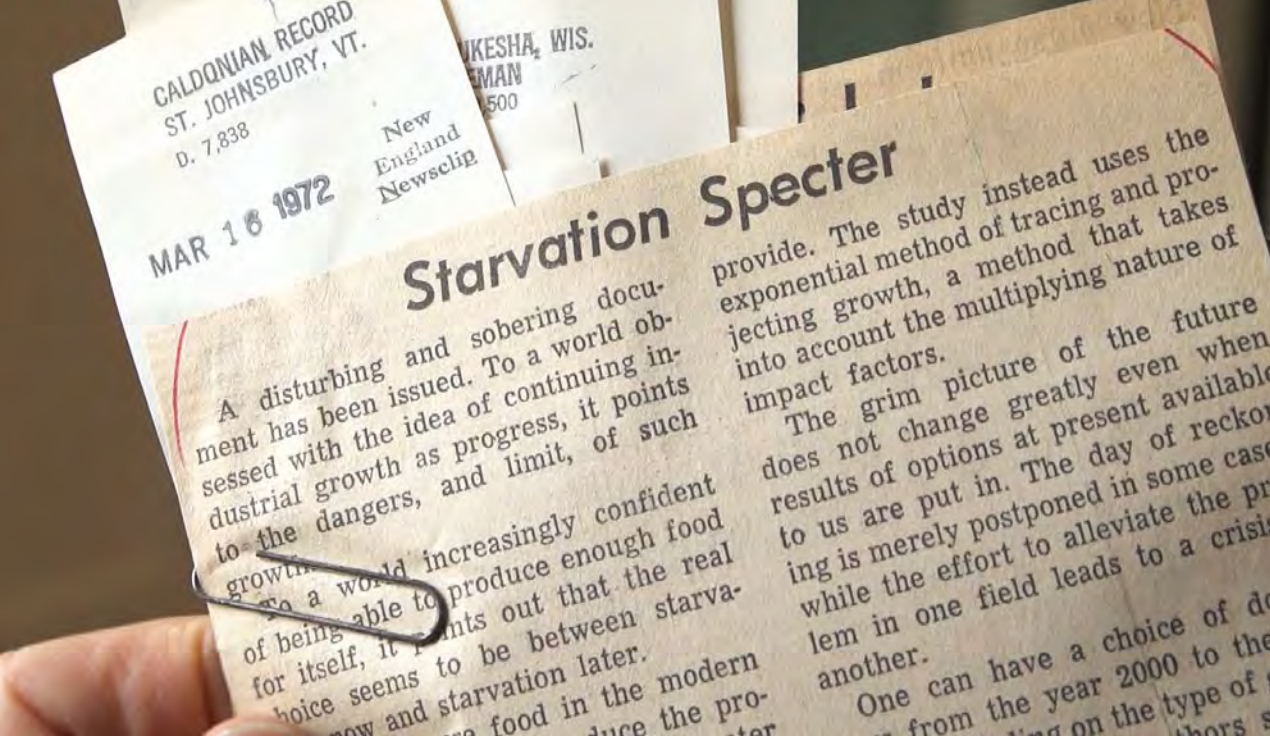
Fig. 1.2 – Reazioni della stampa internazionale alla pubblicazione del Report del MIT. Fotogramma dal documentario "Last call", prod. Zenit Arti Audiovisive/Skofteland Film (E. Cerasuolo, 2013).