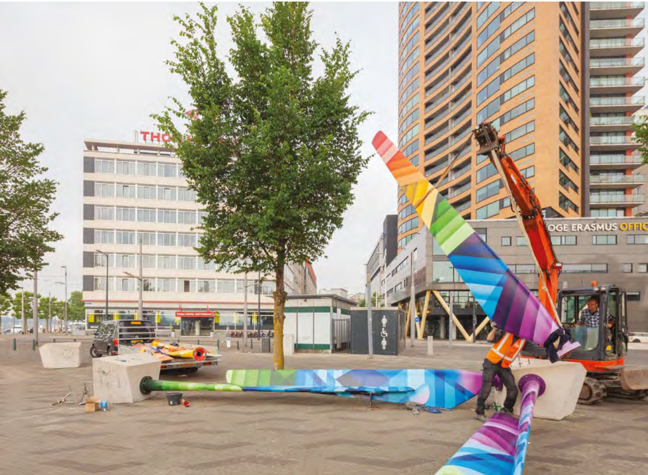
Fig. 7.3 – REwind @ Willemsplein, dal 2020 monumento alla diversità sessuale e di genere (rinominata dagli stessi autori "Blade-Made Willemsplein LGBTQI+"). Immagine del ri-montaggio degli elementi dopo l'intervento dell'artista Mr. June.